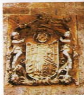
Escudo de la calle Juan Herrero

La Arquitectura Popular y el Ecomuseo, como ejemplo de difusión de las tradiciones y costumbres de nuestro pueblo, abren la puerta a un nuevo gusto por la búsqueda de las raíces en lo básico de la vida. El museo recrea una antigua casa de labranza, con todos sus útiles y aperos y, ofrece una muestra de los oficios básicos de la zona.