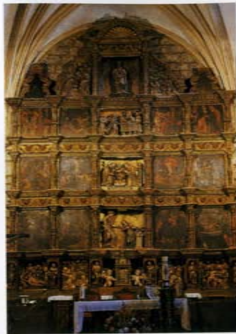
Retablo Mayor Sta. María La Sagrada

La Iglesia de Santiago, de una importante influencia mudéjar, alberga un Retablo de principios del s. XVII, cuya autoría apunta hacia los Maestros de Toro. Un púlpito de estilo gótico labrado en yeso, junto con el artesonado y el coro con restos pictóricos gótico-mudéjares, completan la riqueza del templo.